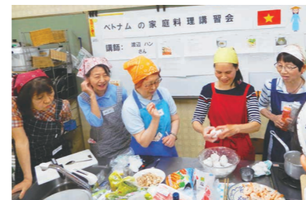
▲過去の講習会の様子

申込み 5月17日までに電話またはanin@nifty.comで、中野区国際交流協会へ。抽選で15人。☒講座名、住所、氏名とふりがな、電話番号、出身地 ☆結果は、全応募者に通知